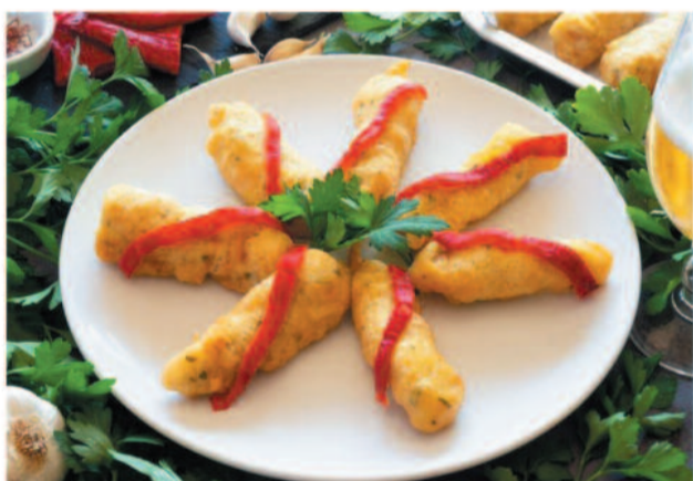
Del 17 al 19 Soldaditos de Pavía