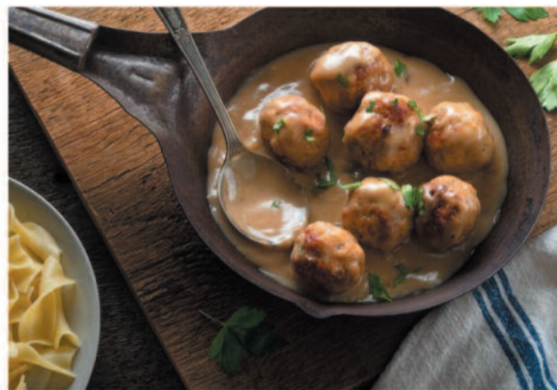
Del 10 al 12 Albóndigas de pollo en pepitoria