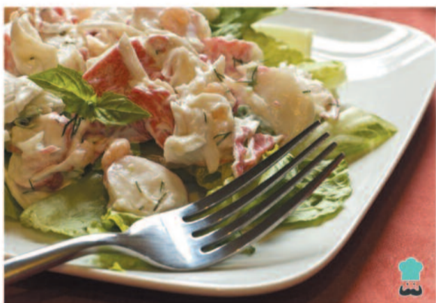
Del 3 al 5 Ensaladilla Rusa de cangrejo