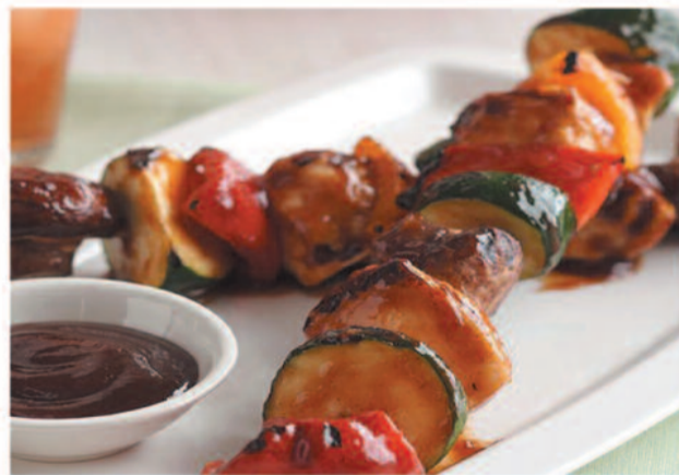
Del 24 al 26 Brochetas de solomillo de ternera con salsa cazadora